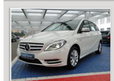
B 180 BE Sports Tourer E2L 05/12, 4.181 km, 90 kw, 1.595 cm³, Benzin, GFG-Nr. 6761, 23.480 €